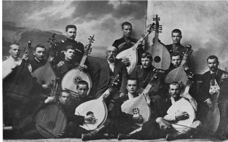
Капела кубанських бандуристів

Головним ударом по інтелігенції була справа Спілки визволення України (СВУ). Ще у квітні 1929 р. видатних українських вчених і письменників звинуватили в підготовці збройного повстання, утворенні підпільної контрреволюційної організації СВУ. У липні в Україні у зв'язку із справою СВУ почалися масові арешти, а в грудні вони прокотилися і по Кубані. Були заарештовані за справою «Союзу Кубані та України». З 9 березня до 20 квітня 1930 р. в Харкові відбувався