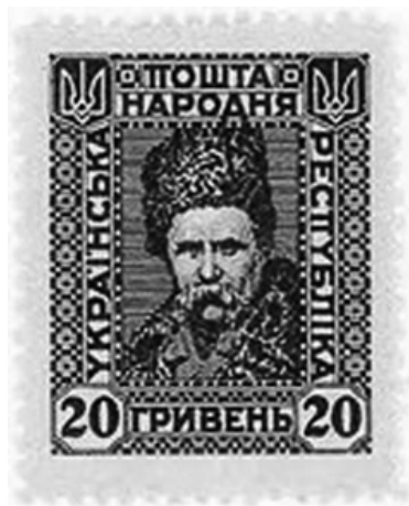
Марки із зображенням Т. Шевченка із серії УСРР «Допомога голодуючим» (1923 р.) і «віденської» серії УНР (1921 р.)

На марці «Селянин, який роззброїв смерть» у коричневому та чорному кольорах є зображення селянина у ромбі, який вириває косу із кістявих рук скелета. По кутах зображення розташовані заголовні букви «У», «С», «Р», «Р» всередині кіл, утворених листям. Напис над малюнком – «ПОШТА 90 карб.», унизу – «Допомога + 30 карб. голодуючим».