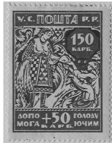
Марка номіналом «150+50 карб» із серії УСРР «Допомога голодуючим»

На марці з найбільшим номіналом зображено, за описом Ф. Чучіна 1923 р., молоду селянку у національному вбранні, яка однією рукою подає хліб голодним – жінці та дитині, а іншою підтримує сніп стиглого колосся пшениці 63 . Як правило, цей малюнок інтерпретують як алегорію України, що роздає хліб 64 .