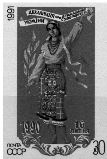
Поштова марка «Державний суверенітет України» (1991 р.)

«Почта СССР» 2 . Так 10 липня 1991 р. в обігу з'явилися україномовна марка СРСР, а не суверенної України. Центральна влада протидіяла «параду суверенітетів» і на поштовому фронті, адже поштовою марку через її символічну значущість можна розглядати як один із атрибутів державності.