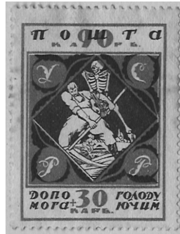
Марка номіналом «90+30 карб» із серії УСРР «Допомога голодуючим»

На марці з найбільшим номіналом зображено, за описом Ф. Чучіна 1923 р., молоду селянку у національному вбранні, яка однією рукою подає хліб голодним – жінці та дитині, а іншою підтримує сніп стиглого колосся пшениці 63 . Як правило, цей малюнок інтерпретують як алегорію України, що роздає хліб 64 .