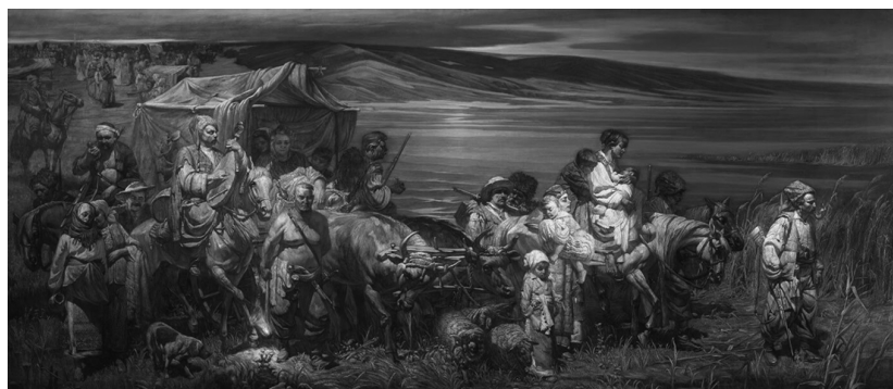
Переселення запорожців на Кубань

Після ліквідації Російською імперією Війська Запорізького в 1775 р., українські козаки доклали багато зусиль, аби зберегти його. Врешті-решт колишнім старшинам Війська Запорізького – Антіну Головатому, Сидору Білому і Захару Чепизі – вдалося добитися офіційного відновлення Війська Запорізького, але вже під новою назвою – Чорноморського козацького війська. Для новоутвореного угруповання потрібне було нове місце розташування. Більшість земель колишнього Війська Запорізького вже була розподілена між російськими можновладцями, тому козаки-чорноморці вирішили переселитися на Кубань, яку добре знали, де територія і клімат дуже схожі на звичні українцями сонячні степи. Переселення чорноморських козаків на Кубань почалося влітку 1792 р. і тривало до 1795 р. За цей час на Кубань переселилося близько 18 тис. козаків, більшість із яких становили колишні запорожці. Це був лише початок масового переселення українців на Кубань. Сотні тисяч вихідців із Харківської, Полтавської, Чернігівської, Катеринославської губерній перебралися на Кубань, де і стали більшістю населення та основою Чорноморського козацького війська, а з 1860 р. – Кубанського козацького війська. Українці Кубані ніколи не поривали зв'язків з Україною і вважали рідну Кубань частиною України.