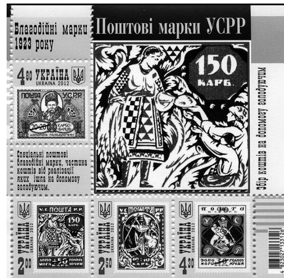
Поштовий блок № 101 «Поштові марки УСРР» (2012 р.).

йдучи за нормами сучасного українського законодавства про благодійну діяльність 12 . У 1920-х рр. у офіційному вжитку в УСРР був термін «добродійні марки» 13 , відповідно у каталогах марок і статтях про філателію вживалися терміни «поштові добродійні марки», іноді – «добročинні». Часом і сучасні дослідники використовують ці тотожні терміни, але ми у цій статті зупинились на варіанті «поштові благодійні марки», який зафіксовано у каталогах оператора поштового зв'язку України.