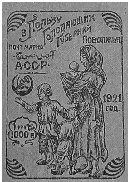
Марки АзСРР «В Пользу Голодающих Губерний Поволжья» (1921 г.)

У липні 1921 р. була утворена Центральна комісія по боротьбі з голодом при Всеросійському Центральному Виконавчому Комітеті (скорочено ЦК Допгол або ЦКДГ при ВЦВК) на чолі з головою ВЦВК М. Калініним. У зв'язку із зверненням цієї комісії Народний комісаріат пошт і